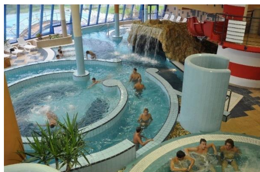
A Kaposvári Virágfürdő fedett élménymedencéi

köblényi közeli hozzátartozók is jelentkezhetnek. Maximális létszám: 50 fő, melyet jelentkezési sorrendben töltünk föl.