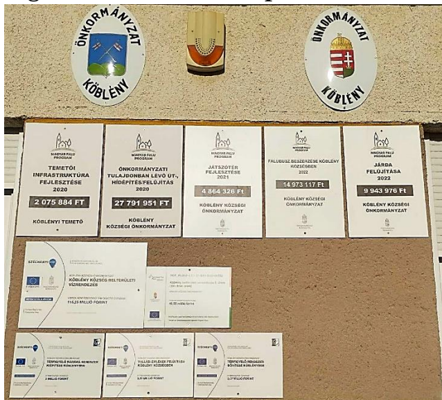
Pályázati eredményközlők a faluház falán

Szintén sikerrel pályáztunk a 2023. májusában a sportpályánál megcsúszott partfal és útszakasz javítására a Belügyminisztérium Vis maior keretéből. A munkálatok 2024 tavaszán fejeződtek be, stabil támasztást adva az útnak és falnak, mellyel a szomszédos ingatlan is védelmet kaphatott.